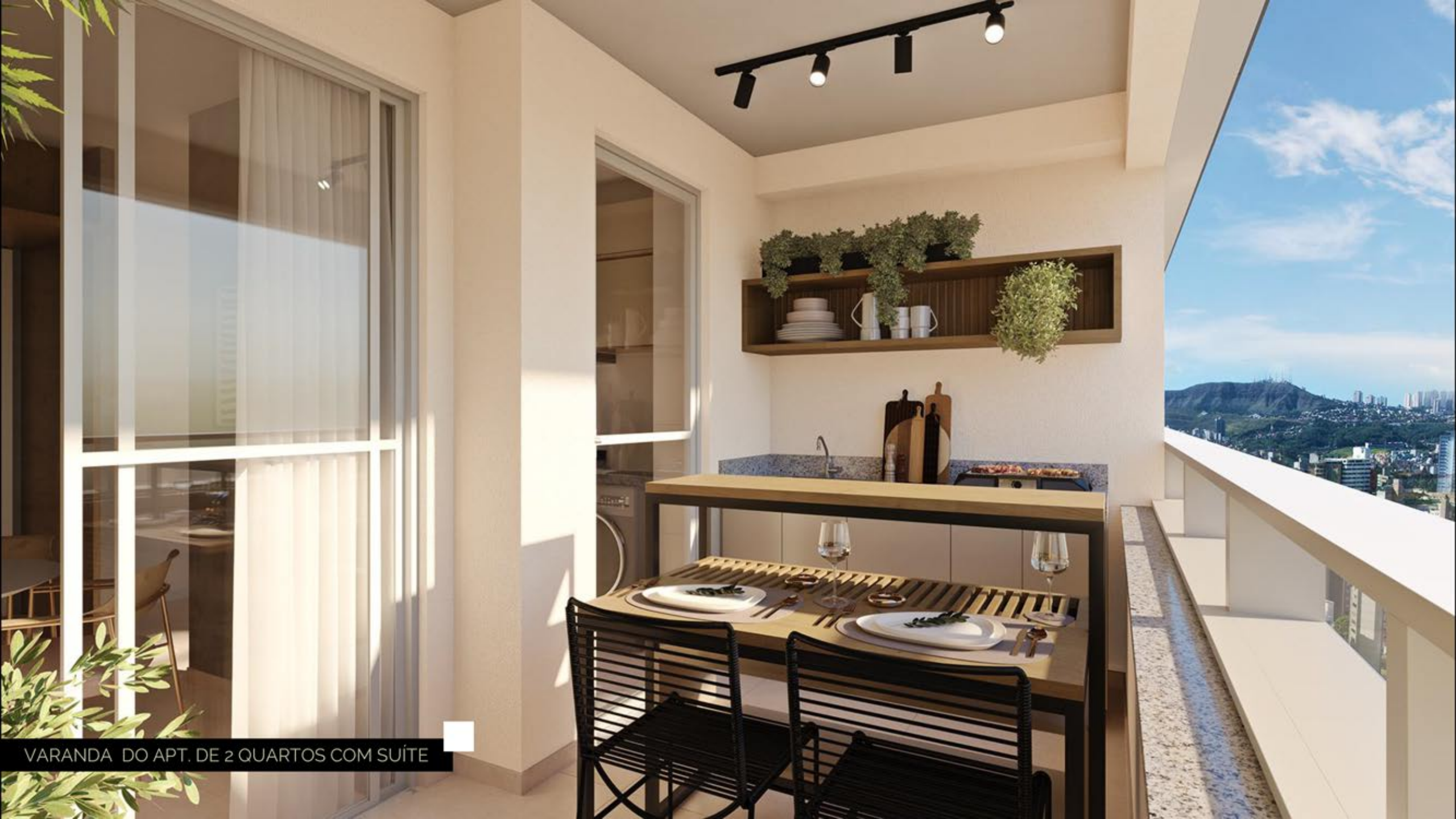
VARANDA DO APT. DE 2 QUARTOS COM SUÍTE