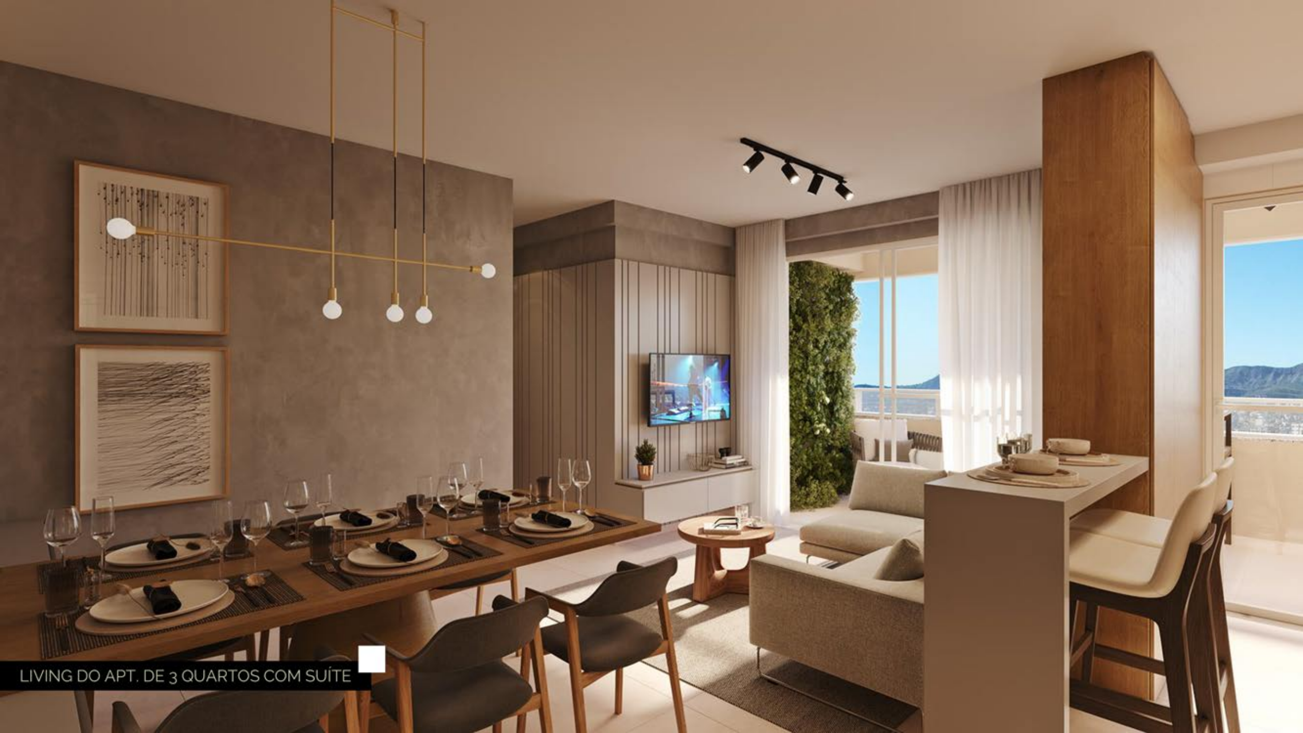
LIVING DO APT. DE 3 QUARTOS COM SUÍTE