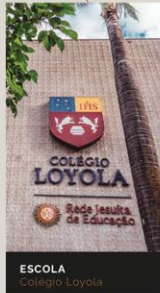
ESCOLA Colégio Loyola