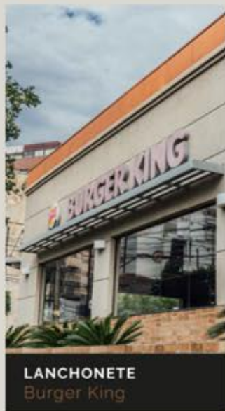
LANCHONETE Burger King