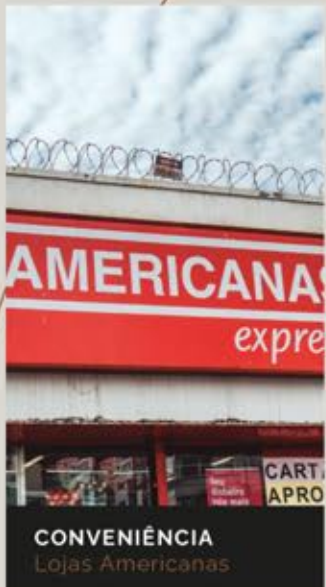
CONVENIÊNCIA Lojas Americanas