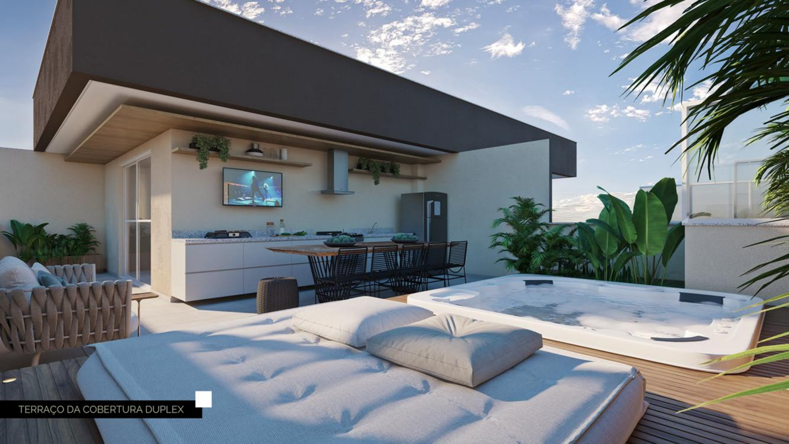
TERRAÇO DA COBERTURA DUPLEX