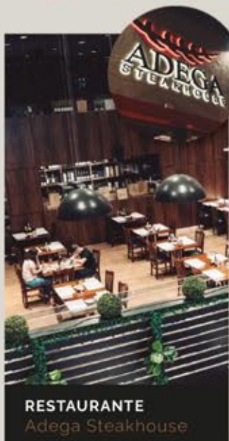
RESTAURANTE Adega Steakhouse