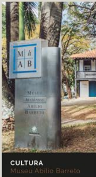
CULTURA Museu Abílio Barreto