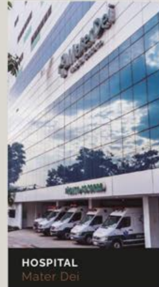
HOSPITAL Mater Dei