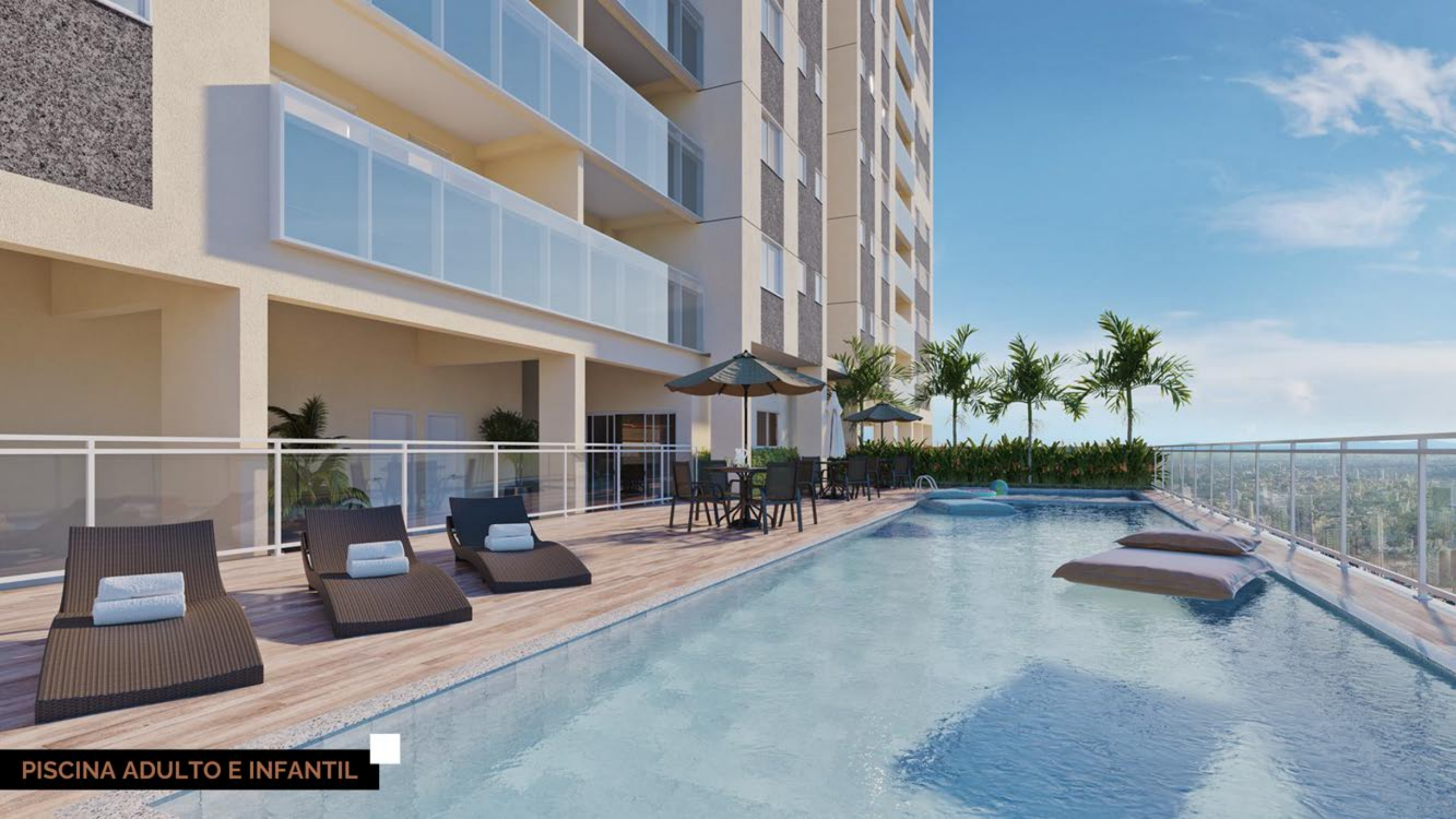
PISCINA ADULTO E INFANTIL