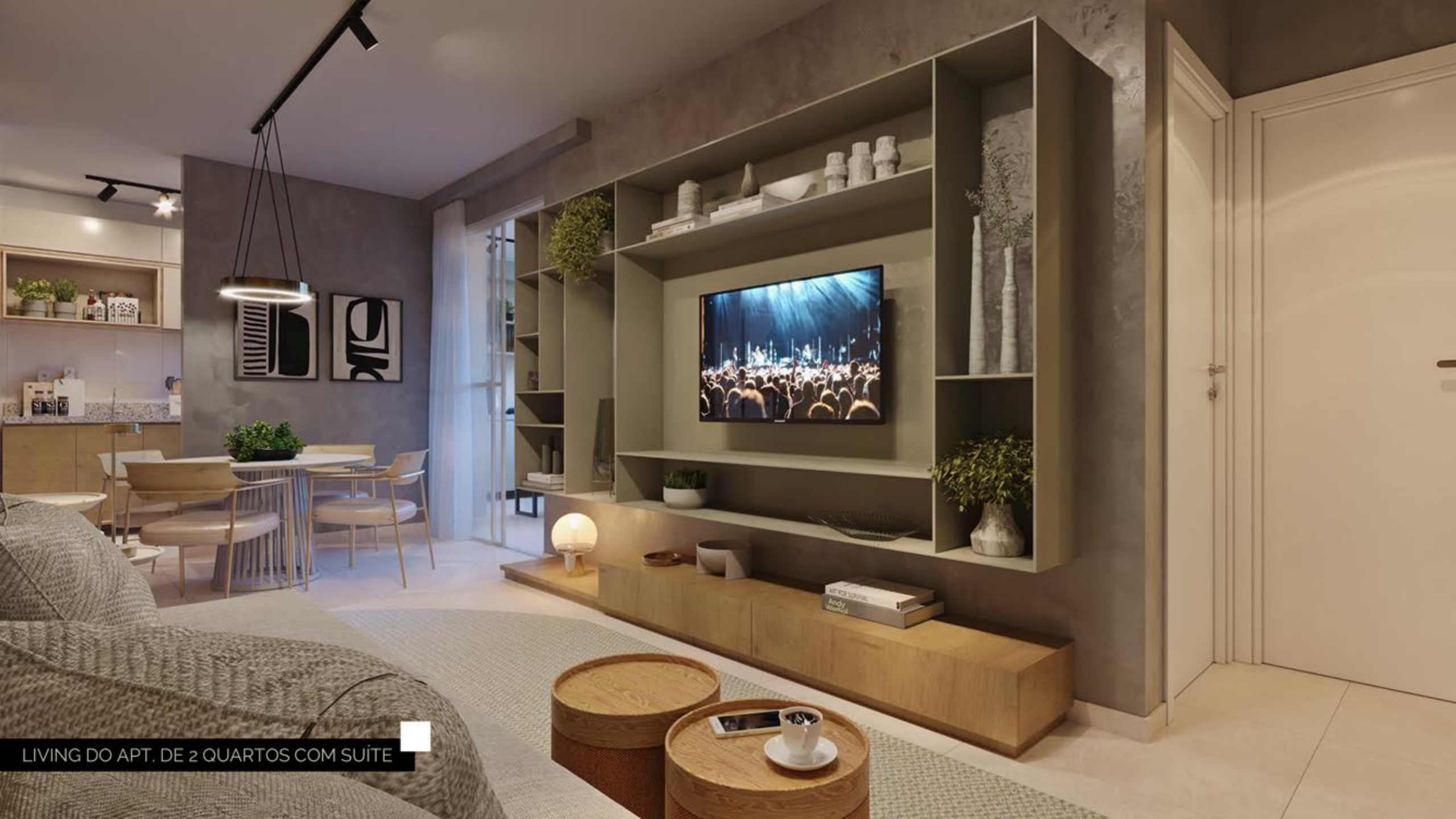
LIVING DO APT. DE 2 QUARTOS COM SUÍTE