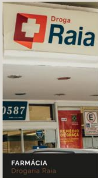
FARMÁCIA Drogaria Raia