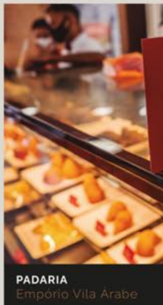
PADARIA Empório Vila Arabe